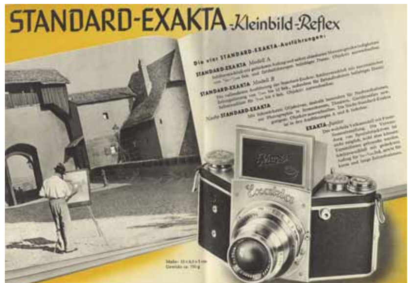
„Standard Exakta: Die ideale Kleinbild-Reflex“ – 12seitiger Standard-Exakta Prospekt von 1939. Abgebildet ist eine Exakta B der Version 5.2, ausgestattet mit einem Tessar 2,8/7,5 cm.

Wer sich den frühen Exaktas als Sammelgebiet widmet, sieht sich einer recht großen Bandbreite an Modellvarianten gegenüber, die auf Anhieb nicht so leicht auseinanderzuhalten – und auch nicht so einfach komplett zusammenzutragen – sind.