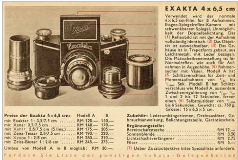
Die interessante Beschreibung der Standard Exakta-Modelle einschließlich Preisinformation ist dem Schaja Photoführer von 1937 entnommen. Unten: Exakta Anzeige aus dem Jahr 1934.

Am 05. März 1933 – also vor 75 Jahren – stellte die Ihagee auf der Leipziger Frühjahrsmesse eine Spiegelreflexkamera für den 127er Rollfilm vor, die Exakta 4 x 6,5. Hierbei handelt es sich um eine trapezförmige SLR in massiver, aber durchaus kompakter Ausführung. Sie hat einen 45 Grad geneigten Spiegel und einen einklappbaren Lichtschachtsucher. Sie besitzt einen