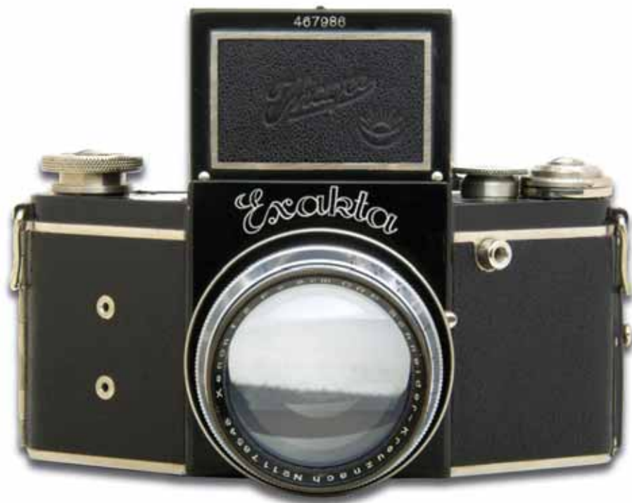
Nacht-Exakta Modell B, ausgestattet mit dem lichtstarken Schneider Xenon 2,0/8 cm. Entgegen der anderen Baureihen ist die Seriennummer bei der Nacht-Exakta am Lichtschacht eingraviert.

A&R kennen auch hier insgesamt sechs Versionen. Die Kameras wurden zwischen 1934 und 1939 hergestellt.