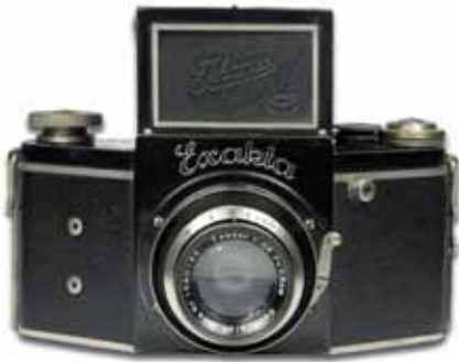
Kamera Nr. 437668, Modell B, V. 4.1, hergestellt zwischen 1935 und 1938, ausgestattet mit Tessar 2,8/7,5cm von Carl Zeiss Jena

von 5,5 cm bis 36 cm können genutzt werden. Auch Blitzanschlussbuchsen für den Ihagee Vakublitz sind verfügbar.