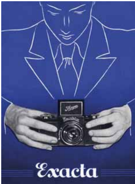
Titelseite eines französischen Exakta-Prospektes von 1935

spannhebel und in schwarzer Ausführung. Die Preise für diese Modelle liegen zwischen €150,- und €250,-. Die älteren Modelle können je nach Zustand bis zu €400,- erreichen. Die Junior-Exakta liegt zwischen €200,- und €400,-, die Nacht-Exakta zwischen €400,- und €800,-.