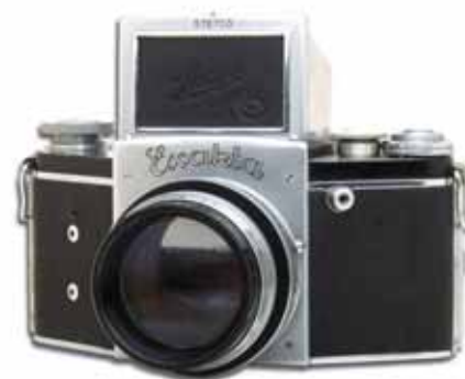
Ebenfalls Nacht-Exakta B, diesmal in Chromausführung und mit dem Meyer Primoplan 1,9/8 cm

Die als „Spezialobjektive“ bezeichneten Optiken wurden von verschiedenen Herstellern gebaut. Zu nennen sind hier: