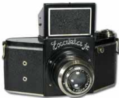
Die Exakta Junior – die einfache Exakta-Variante – mit Seriennummer 490161 und Anastigmat 3,5/7,5 cm in schwarzer Ausführung

dell A und drei Versionen basierend auf Modell B produziert. Diese Baureihe wird mitunter auch als Modell C bezeichnet,