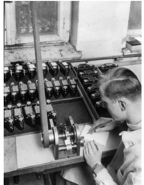
Ein Blick in die Produktion der Exakta in Dresden – hier B-Modelle mit Schalthebel bei der Montage des Langzeitknopfes und der Endkontrolle.

Wehrmacht eingezogen und gilt seit 1945 als verschollen.