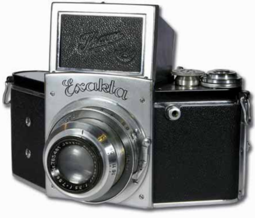
Exakta Modell A, Version 5.1 und Seriennummer 489274, Baujahr 1937-1939, in der selteneren Chromausführung. Objektiv ist ein Ihagee Exaktar 3,5/7,5 cm.

Dieses Modell wurde ebenfalls zwischen 1933 und 1939 hergestellt. Im Grunde gab es zu jeder Version des Modells A ein korrespondierendes Modell B. Letzteres wird durch die langen Zeiten charakterisiert. Diese sind: 1/10 s, 1/2 s, 1 s, 2 s, 3 s, 4 s, 5 s, 6 s, 7 s, 8 s, 9 s, 11 s und 12 s. Der zusätzliche Einstellknopf auf der Kamera-Oberseite beinhaltet allerdings noch eine weitere Funktion. Hier wird das Hemmwerk der Kamera eingestellt. Der Selbstauslöser ist sowohl für die kurzen als auch für die langsamen Zeiten (bis 6 s) einsetzbar.